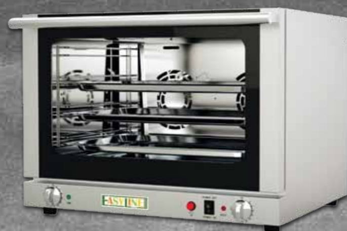
H7530 GN 1/1 Modell H7530 mit manueller Beschwadung 2 Lüftermotore